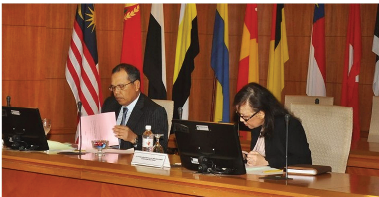
Mesyuarat Suruhanjaya Perkhidmatan Kehakiman dan Perundangan ke-126 pada 6 Mac 2015 di Putrajaya

The Judicial and Legal Service Commission's 126th Meeting on 6th March 2015 at Putrajaya