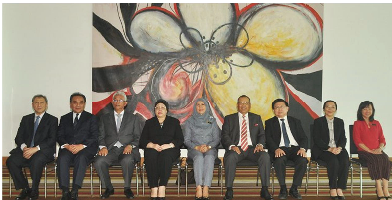
Mesyuarat Suruhanjaya Perkhidmatan Kehakiman dan Perundangan ke-127 pada 8 September 2015 di Kuching, Sarawak

The Judicial and Legal Service Commission's 127th Meeting on 8th September at Kuching, Sarawak