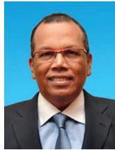
YAA Tan Sri Dato' Seri Md. Raus Bin Sharif