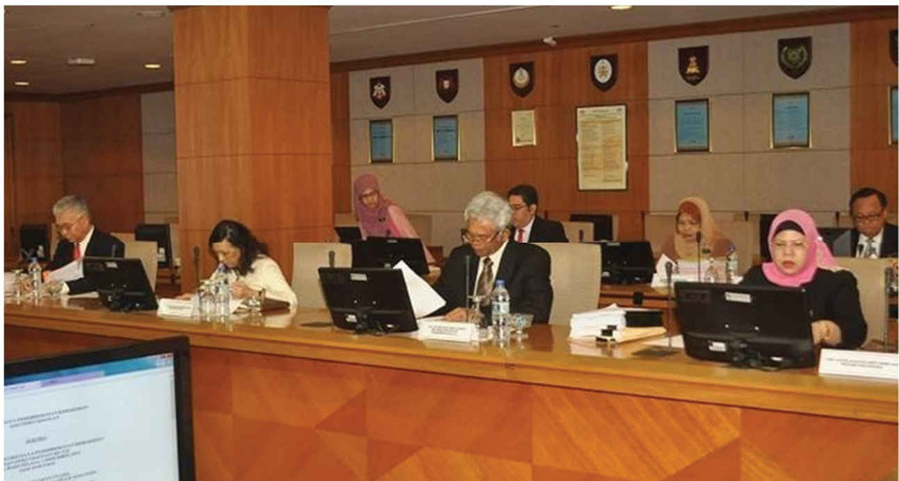
Mesyuarat Suruhanjaya Perkhidmatan Kehakiman dan Perundangan ke-128 pada 1 Disember 2015 di Putrajaya

The Judicial and Legal Service Commission's 128th Meeting on 1st December 2015 at Putrajaya